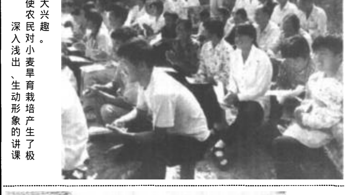
使农民对小麦旱育栽培产生了极大兴趣